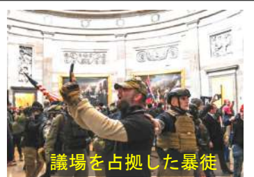
議場を占拠した暴徒