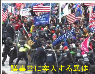
議事堂に突入する暴徒

大阪維新のメンツという党利党略、不急不用な「条例化」は止めて、新型コロナ感染対策に全力で当たるべきである。新型コロナ禍で市民が内容を考える余裕がないことをいいことに、議会内の「多数派」を悪用して進めることは許されない。隠れてコソコソすることは止めろ!