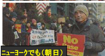
ニューヨークでも

12月14日安倍政権は辺野古新基地建設予定地シュワブ南岸への土砂の投入を開始した。15日にはゲート前で抗議集会が開かれ、玉城知事も参加して「われわれの打つ手は必ずある。我々の闘いは止まりません。本当の民主主義を求めていこう」と訴えた。