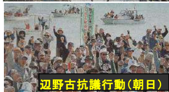
辺野古抗議行動(朝日)