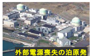
外部電源喪失の泊原発

泊原発の周辺は震源から遠く離れて震度は2程度であったが、非常事態となった。原発には3系統の送電線から電源が供給されているのに外部電源は切断された。非常用発電機が稼働したことによって、最悪の事態は回避された。しかし、苫東厚真発電所と同じ震度7の地震が発生したら大事故が発生していた可能性がある。