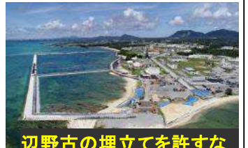
辺野古の埋立てを許すな